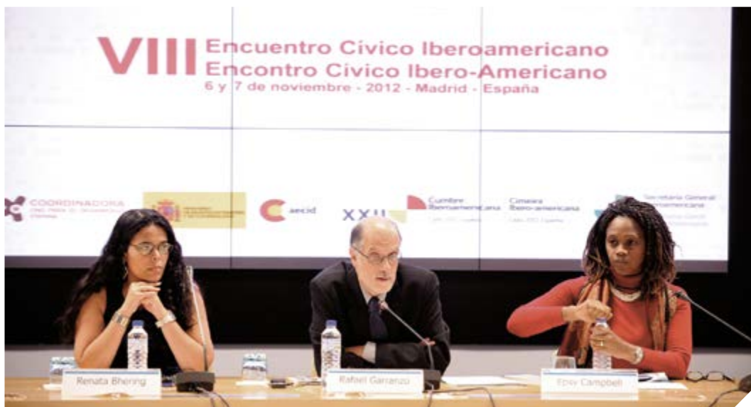
Participantes del VIII Encuentro Cívico Iberoamericano. Madrid, 6 y 7 de noviembre de 2012.

Año 2009-V Encuentro Cívico Iberoamericano. Lisboa. Portugal. “Innovación y conocimiento”.