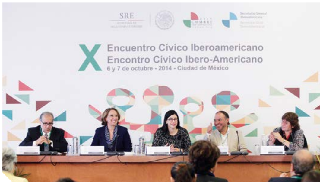
Participantes en el X Encuentro Cívico Iberoamericano. 6 y 7 de octubre de 2014, Ciudad de México.

Se armó un cronograma con espacios de interlocución, donde la Cancillería de México apostó con recursos.