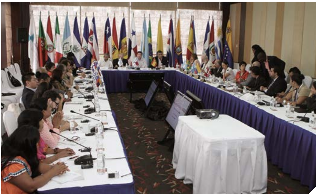
Participantes del IX Encuentro Cívico Iberoamericano, Panamá, 14 de septiembre de 2013.