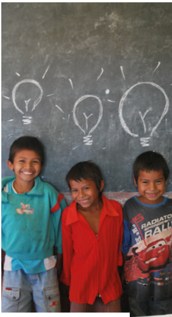
Luces para aprender es una iniciativa de la OEI que lleva la luz e internet a las escuelas en Iberoamérica situadas en zonas rurales y de difícil acceso.

Implementado desde el 2014, en el marco del programa Iberoamericano de desarrollo profesional docente, se ha centrado en la movilidad de profesores en ejercicio a través de redes de innovación educativa. En su primera edición han participado un total de 266 movilizaciones en 15 países de la región.