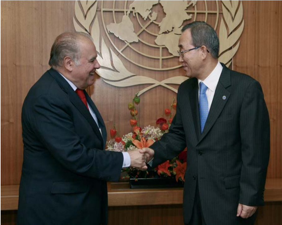
El Secretario General Iberoamericano, Enrique V. Iglesias, a la izquierda, saluda al Secretario General de Naciones Unidas, Ban Ki-moon.

Salud, con Kemal Dervis, Administrador del PNUD; encuentro con George Kell, Director del Pacto Global de las Naciones Unidas para lanzar el capítulo Iberoamericano de esta iniciativa; y la Secretaria General Adjunta de Administración y Gestión de las Naciones Unidas, Alicia Bárcena.