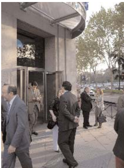
Entrada principal de la sede de la SEGIB en Madrid

L a SEGIB ha mejorado la proyección internacional de nuestra Comunidad. A ello han contribuido las reuniones de Enrique V. Iglesias con el Secretario General de la ONU, Ban Ki-moon; el encuentro con los embajadores iberoamericanos ante la UNESCO; la firma de un acuerdo en la Cumbre América Latina y Caribe-Unión Europea; la asistencia a la Asamblea Parlamentaria Euro-latino-