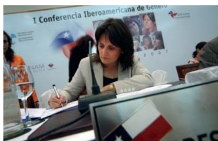
La Ministra chilena del Servicio Nacional de la Mujer, Laura Albornoz, firma la Declaración de la I Conferencia Iberoamericana de Género.

El XII Foro Iberoamericano de Ministros y Autoridades Máximas de Vivienda y Desarrollo Urbano se celebró junto con la XVI Asamblea de Ministros de Vivienda y Urbanismo de América Latina y el Caribe (MINURVI) en la sede de la CEPAL. El debate del Foro giró en torno al Derecho a la Ciudad como condición necesaria para garantizar localidades inclusivas y sociedades cohesionadas. Tal derecho consagra no solamente la garantía de acceso a una vivienda adecuada en un entorno ambiental sano y sin precariedades de ningún tipo, sino también el