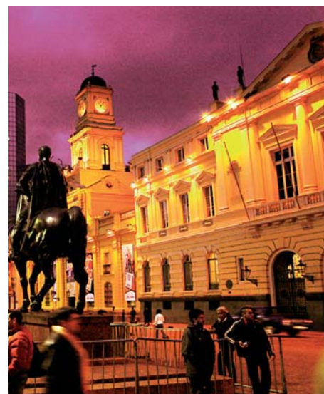
Sobre estas líneas, a la izquierda, vista general de la capital Chilena, Santiago, con la cordillera de los Andes enmarcándola por el este. Arriba y a la derecha, vista de la Plaza de Armas y la catedral desde dos ángulos y con dos luces diferentes.