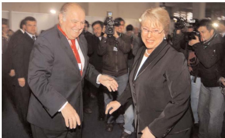
La Presidenta de Chile, Michel Bachelet, recibe al Secretario General Iberoamericano

Con el mismo esmero con el que hace once años llevó adelante la realización de la VI Cumbre Iberoamericana de Jefes de Estado y de Gobierno de Santiago y de Viña del Mar, el gobierno de Chile se dispone a cerrar exitosamente entre el 8 y el 10 de noviembre próximo, durante la celebración de la XVII Cumbre, un completísimo calendario de reuniones de los más diversos ámbitos bajo el lema común de "Cohesión social y políticas sociales para alcanzar sociedades más inclusivas en Iberoamérica".