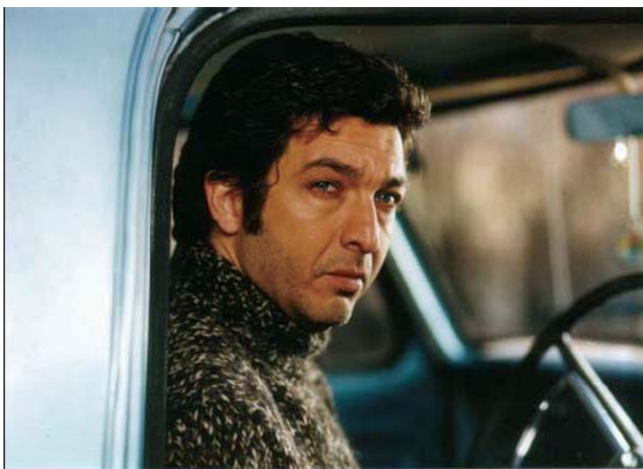
Fotograma de Kamchatcka (Argentina/España, 2002)

E s claro y evidente que la solución a nuestro cine es la cooperación, la conformación de un entramado que ligue a nuestros distintos países y ello desde dos conceptos adicionales: la solidaridad y la reciprocidad.