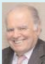
Enrique V. Iglesias