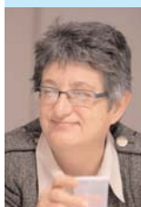
Angeles Yáñez-Barnuevo Directora de la División de Asuntos Sociales SEGIB

Los 34 millones de analfabetos absolutos que existen hoy en día en el conjunto de países iberoamericanos constituyen un serio problema para los gobiernos de la región que han decidido afrontar con decisión, programas y recursos una realidad que, además de significar la vulneración de derechos sociales básicos de las personas, constituye un grave lastre para el desarrollo y el futuro de sus países.