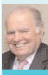
Enrique V. Iglesias Secretario General Iberoamericano