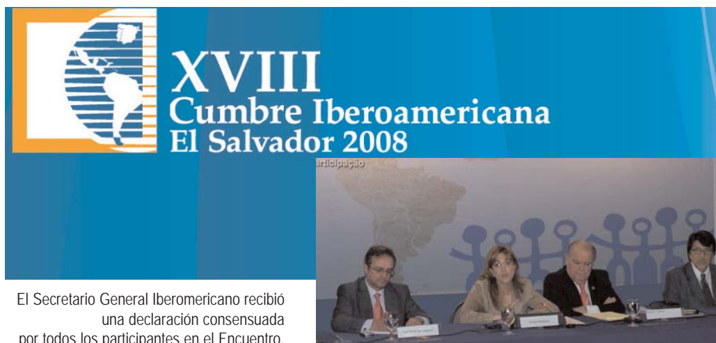
El Secretario General Iberoamericano recibió una declaración consensuada por todos los participantes en el Encuentro.

Ante la crisis financiera mundial que afectará de diferente