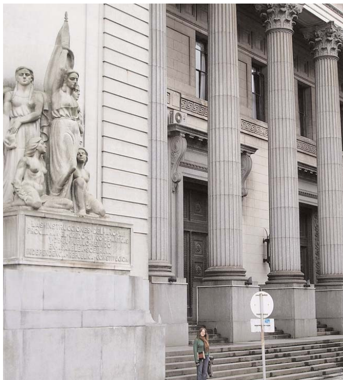
Sede del Banco de la República del Uruguay en Montevideo

Iberoamérica sentirá la caída de los precios de las materias primas, la retracción de los créditos internacionales y de las inversiones, la reducción del envío de remesas por parte de los emigrantes, el endeudamiento de empresas y la