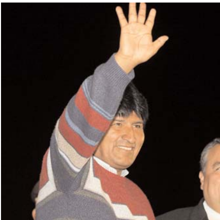
Arriba: la presidenta de Argentina, Cristina Fernández; el presidente de México, Felipe Calderón; el primer ministro de Portugal, José Sócrates; Lula da Silva, presidente de Brasil, con el presidente Antonio Saca, de El Salvador; almuerzo de trabajo durante la Cumbre; llegada de los Reyes de España y el presidente de Bolivia Evo Morales.