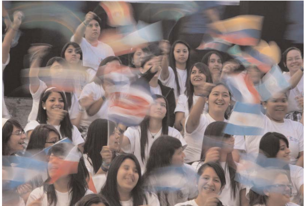
El lema de la Cumbre fue, "Juventud y Desarrollo". En la foto, un grupo de jóvenes salvadoreños dan la bienvenida a los participantes con banderas de todos los países.

Como era de presumir, los ojos de la opinión pública iberoamericana estaban puestos, a fines del mes de octubre, en la crisis financiera global que, ya para ese entonces, podía constatarse a partir de la caída del crecimiento económico de la mayoría de los países más desarrollados, más allá incluso de lo previsto por los principales organismo multilaterales de financiamiento. En esos días, cuando en San Salvador se desarrollaba la XVIII Cumbre iberoamericana y cuando las economías latinoamericanas aún no sufrían del todo la fuerza del embate, pero teniéndose en mente la muy próxima reunión