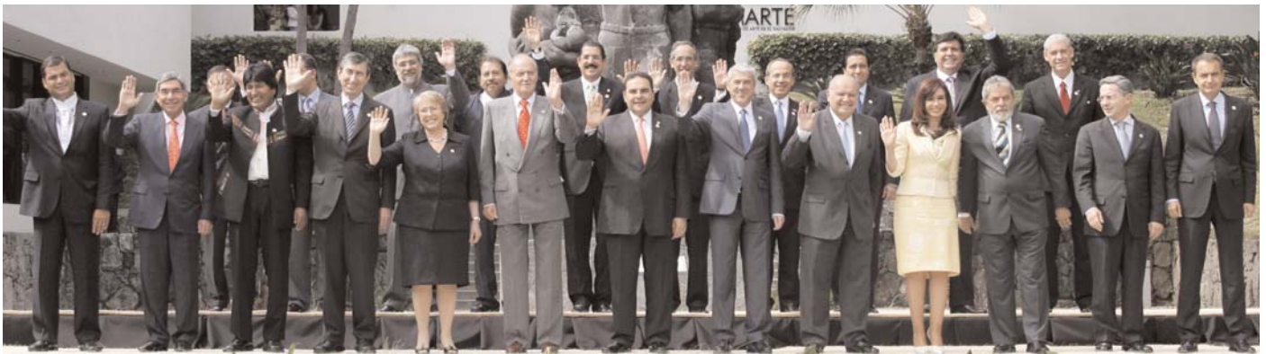
Foto oficial de los Jefes de Estado y de Gobierno en la Cumbre de El Salvador.