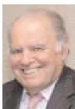
Enrique V. Iglesias Secretario General Iberoamericano