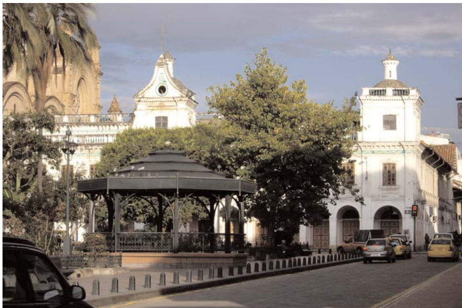
Una calle principal de Cuenca, Ecuador